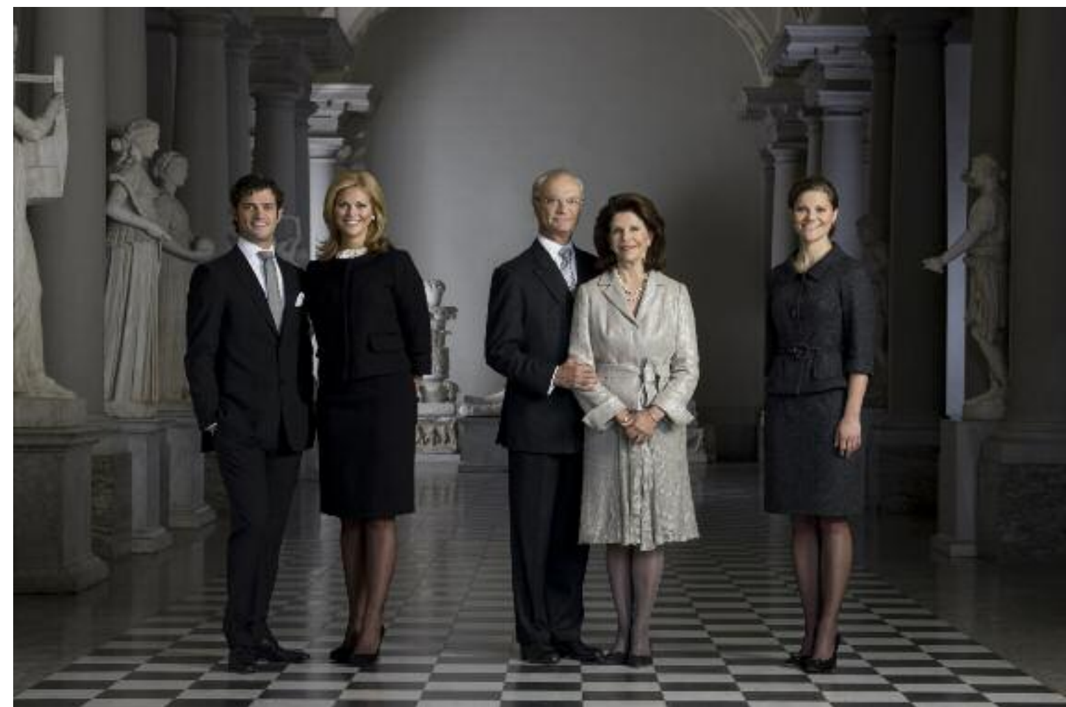
Kongefamilien. Offisielt bilde av Sveriges kongefamilie fotografert i Gustav III:s Antikmuseum.

- Når fotografiet fungerer som best er det som en forlengelse av barndommens leker – bare en tanke mer alvorlig, slutter Bruno Ehrhs.