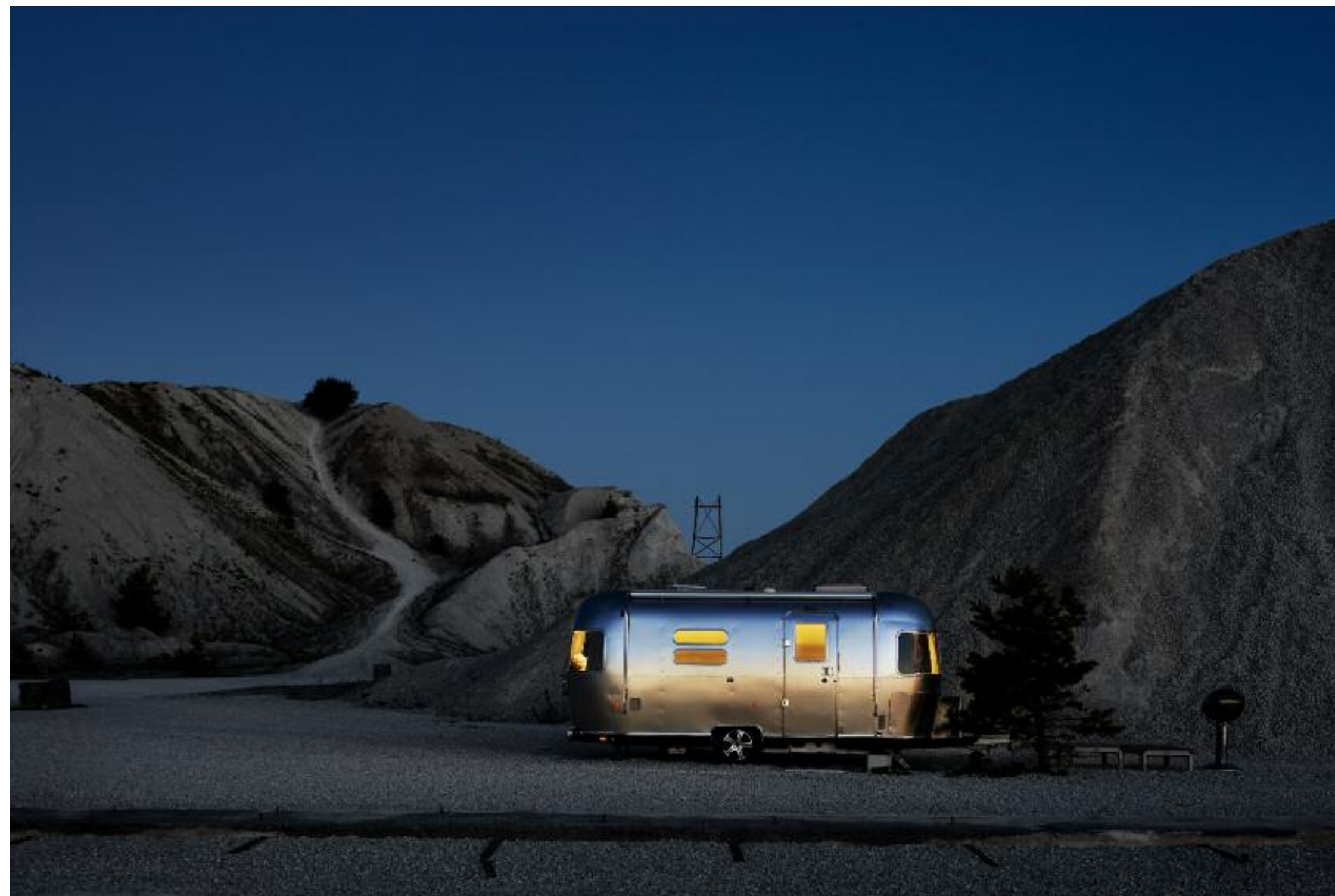
Campingvogn i kveldslys, Furillen på Gotland, Sverige.