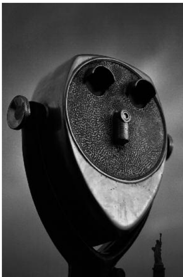
Kikkert ved Battery Park, New York, med Frihetsgudinnen i bakgrunnen