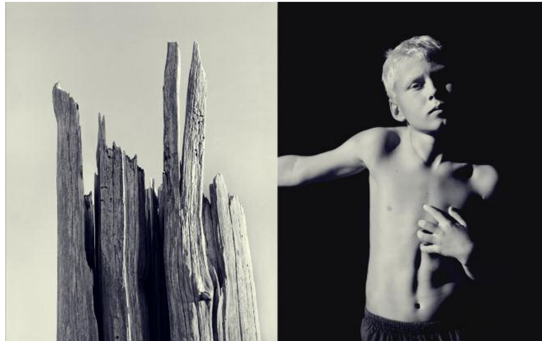
Boy. Fra utstillingen «Memories Of»

Fotograferingen fant sted i februar så det var iskaldt i rommet - en uke før fotograferingen ble det varmet opp ved hjelp av vifteovner.